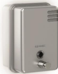
GW04 01 04 01 Inox 304 Satinado