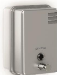
GW04 01 04 02 Inox 304 Brillo